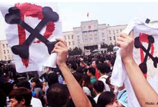
အနီးအနားရှိမြို့ပေါ်လမ်းမများပေါ်တွင် ထောင်ပေါင်းများ စွာသောပြည်သူတို့က စက်ရုံနေရာပြောင်းရွှေ့ပေးရန် ဆန္ဒပြတောင်းဆိုမှု ဖြစ်ပွားခဲ့ပြီးနောက် တရုတ်အာဏာပိုင် များက Dalian ရှိ ရေနံဓါတုစက်ရုံကို ပိတ်ပစ်ရင် အမိန့် ချမှတ်ခဲ့ရသည်