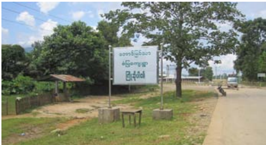
အောင်မြင်သာရွာမှ အဓိကကျသော စစ်ဆေးရေးဂိတ် စခန်း

ထွက်ဆိုချက်။ ကျေးရွာသားတွေကို ပြန်လည်နေရာချထားရေးစခန်းတွေမှာ ပြောင်းနေခိုင်းတယ်။