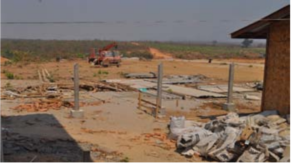
ဖားအံ အထူးစီပွားရေးဇုန်