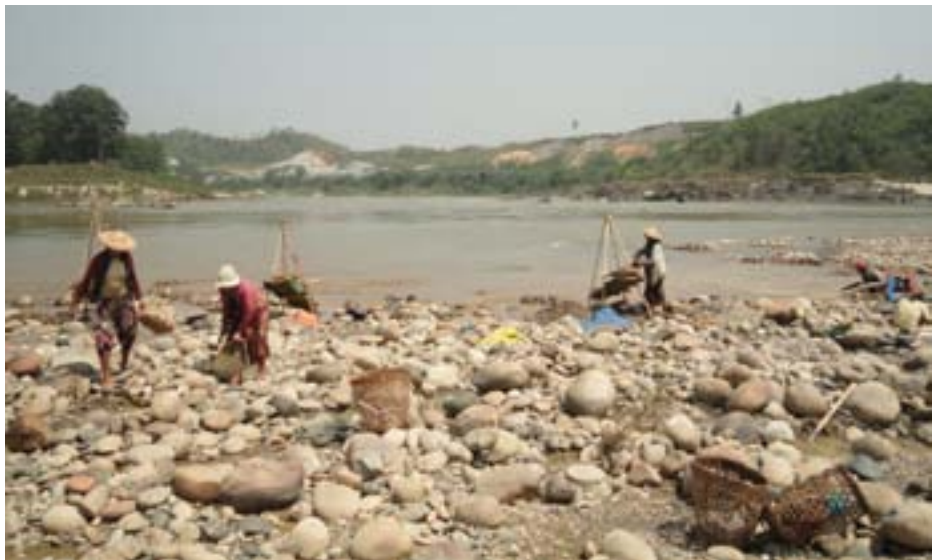
ရွာသားများ မြစ်ဆုံတစ်လျှောက်တွင် အလုပ် လုပ်နေပုံ