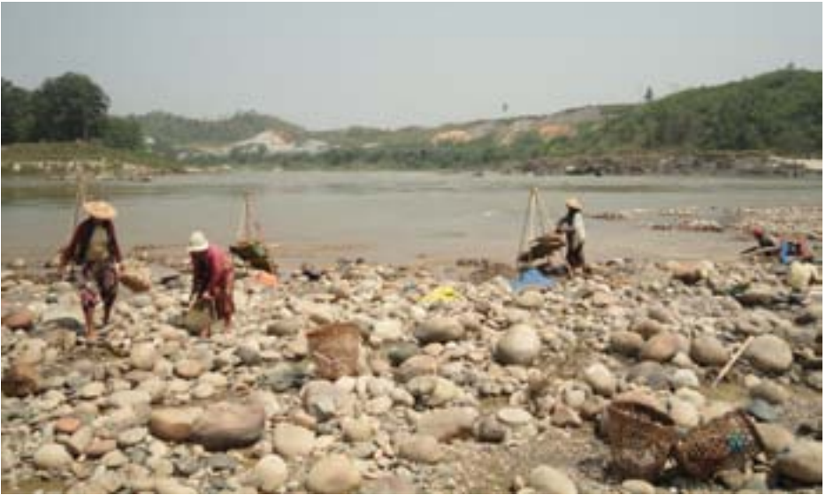
ရွာသားများ မြစ်ဆုံတစ်လျှောက်တွင် အလုပ် လုပ်နေပုံ