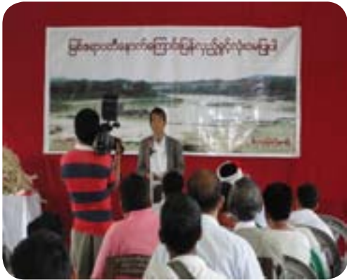
ဒေသခံပြည်သူများ မြစ်ဆုံရေကာတာကို ဆန့်ကျင်သော လှုံ့ဆော်မှုပြုလုပ်နေစဉ်

အားလုံးကိုရရှိခံစားနိုင်ရေးအတွက် အထူးအရေးကြီးသည့်အပြင် လူ့အခွင့်အရေးစံချိန်တပြိုင်တမကြီး အထူးသဖြင့် စီးပွားရေး၊ လူမှုရေးနှင့် ယဉ်ကျေးမှုဆိုင်ရာဖွံ့ဖြိုးတိုးတက်ရေးအခွင့်အရေးနှင့် ကိုယ်ပိုင်ပြဌာန်းခွင့်တို့၏ အခြေခံကျသောအချက်တချက်ဖြစ်ပါသည်။ ကိုယ်ပိုင်ပြဌာန်းခွင့်တွင်လူမျိုးစုတစုရေးအစဉ်အလာကတည်းကနေထိုင်လာခဲ့သောမြေမှာတွေ့ရှိသည့်သဘာဝဝတ္ထုဓနများ၊ သယံဇာတများအားလုံးအပေါ် အပြည့်အဝအာဏာ ပိုင်ဆိုင်ခွင့်ရှိသည်။