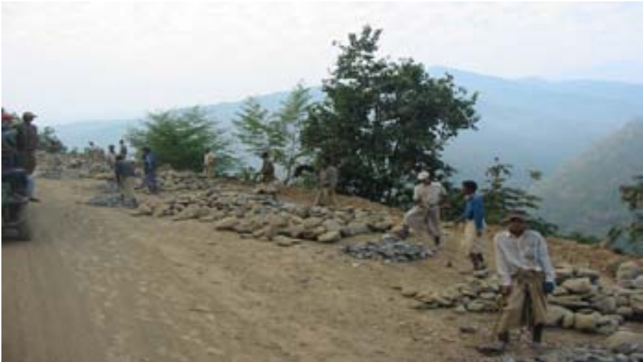
တီတိန်မြို့-ရိဒ်လမ်းတစ်လျှောက်တွင် ပြည်သူလူထု လုပ်အားပေးစေခိုင်းမှုများပြုလုပ်နေသောပုံ

အိန္ဒိယသည် ချင်းပြည်နယ်အတွင်း လမ်းများတည်ဆောက်ရေးမှာ အကြီးအကျယ် ရင်းနှီးမြှုပ်နှံခဲ့ရာ၌ ဤကိစ္စအတွက် မြန်မာအစိုးရကို ဒေါ်လာ(၂)သန်း ထုတ်ပေးမည်ဟု သိရသည်။ ၉၂ ထို့ပြင် ကီလိုမီတာ (၁၆၀)ရှည်သော တမူး-ကလေး-ကလေးမြို့ မော်တော်ကားလမ်း အဆင့်မြင့်ခြင်းနှင့် လမ်းပြန်ခင်းခြင်း လုပ်ငန်းနှင့် ကုလားတန်ခေတ္တနေရာချထားရေးနှင့် ပို့ဆောင်ရေးဆိပ်ကမ်းစီမံကိန်း (Kaladan Multi-Modal Transit Transport Project)တို့တွင်လည်း တက်တက်ကြွကြွပါဝင်ခဲ့သည်။ ၁၉၉၄ ခုနှစ်က အိန္ဒိယနှင့် မြန်မာနိုင်ငံတို့သည် နယ်စပ်ကုန်သွယ်ရေး စာချုပ်တခုကို သဘောတူလက်မှတ်ရေးထိုးခဲ့ပြီး၊ ၂၀၀၅ ခုနှစ် အရောက်တွင် နှစ်နိုင်ငံကုန်သွယ်ရေးကို ဒေါ်လာ(၃)ဘီလျံ တန်ဖိုးအထိရောက်အောင် (၃)ဆတိုးရန်လည်း မကြာသေးမီက သဘောတူခဲ့ကြသည်။ ၉၃ ၉၄ အိန္ဒိယက မြန်မာနိုင်ငံအစိုးရအားမီးရထားလမ်း သယ်ယူပို့ဆောင်ရေးလမ်းနှင့် လျှပ်စစ်ဓာတ်အား ပို့ဆောင်ရေးလိုင်းများအတွက် ဒေါ်လာသန်း(၃၀၀)လည်း ထုတ်ချေးခဲ့သေးသည်။ မြန်မာနိုင်ငံမှာ လောင်းကြေးကြီးကြီးထပ်ထားကြောင်းပြသလိုက်ခြင်းဖြစ်သည်။ ၉၅