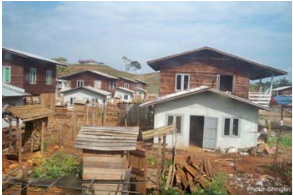
အောင်မြင်သာမှ ရွာသစ်ပုံ

“ဒီရွာသစ်မှာ ကျမတို့က အေရဝေဆီကအထောက်အပံ့ကို တနှစ်စာဘဲရတယ်။ ဒီနေရာမှာ စိုက်ပျိုးစရာ မြေလည်းမရှိတော့၊ ကျမတို့မှာ ဘာလုပ်ရမှန်းမသိတော့ပါဘူး။ ဒါကြောင့်မို့လို့လည်း လူတိုင်းက တန်ဖဲရွာဆီကို ပြန်ချင်ကြတာပေါ့။”