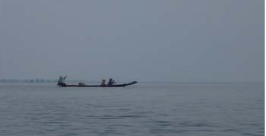
ကယန်းဒေသမှ ရွာသားများ

ထွက်ဆိုချက်။ “ဒီစီမံကိန်းအကြောင်းကို ကျနော်ဘာတခုမှ မသိပါဘူး”